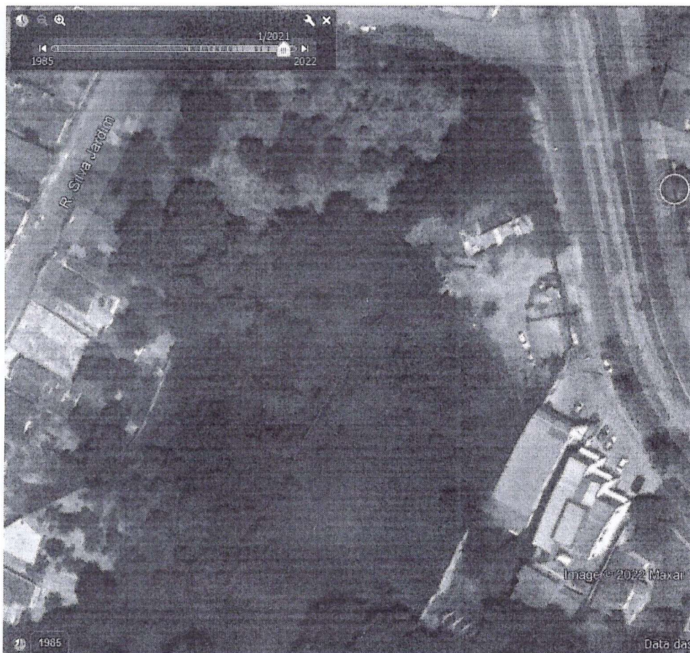
Figura 3. Ortofoto de janeiro/ 2021 da região onde está inserido o imóvel sob exame, destacado pelo perímetro vermelho.

Todavia, na ortofoto mais recente disponível, de abril / 2022, houve uma significativa supressão arbórea em todo o imóvel, além de indícios que houve queimada e movimentação de terra, conforme ilustrado pela Figura 4