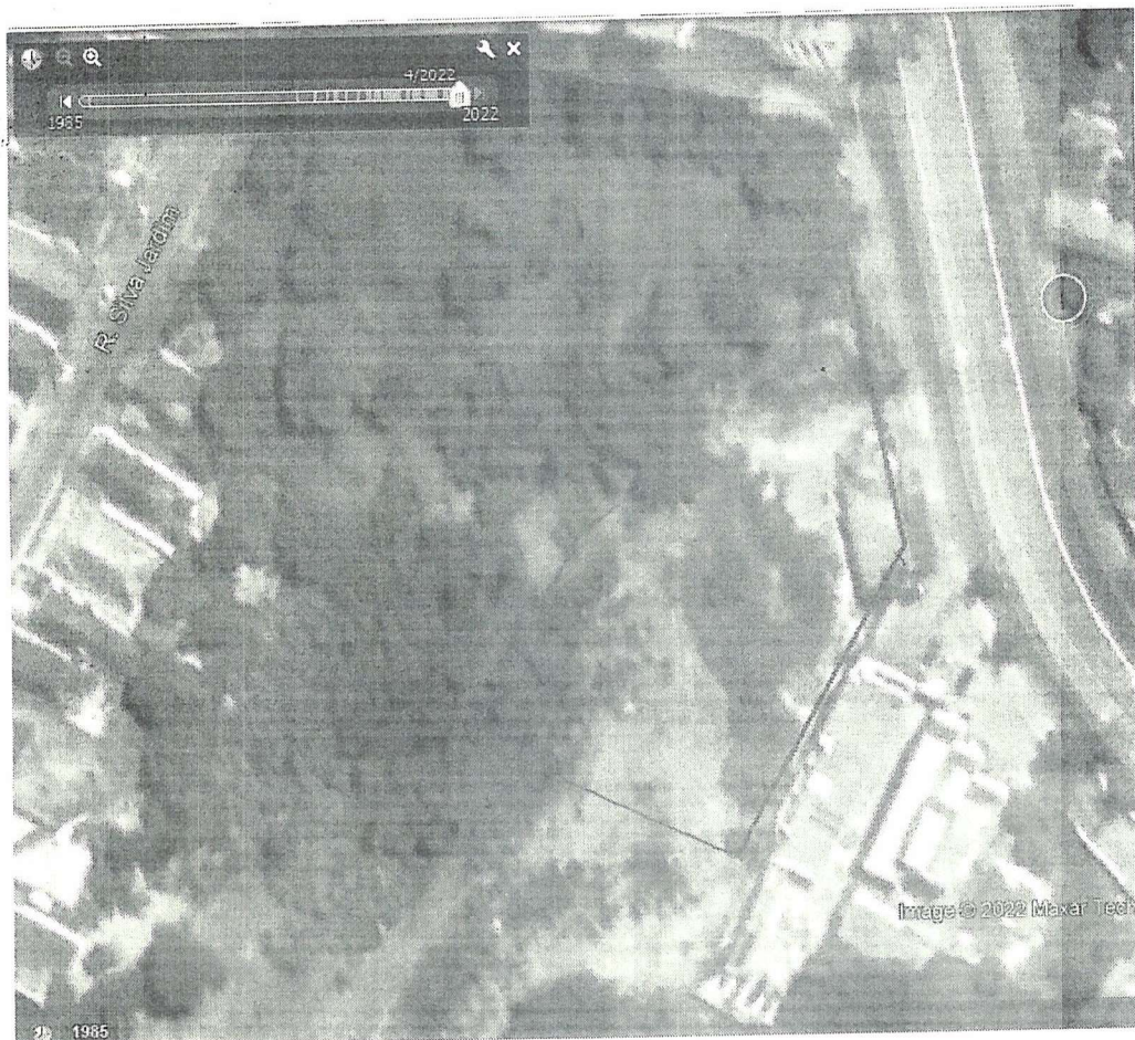
Figura 4. Ortofoto de abril/ 2022 da região onde está inserido o imóvel sob exame, destacado pelo perímetro vermelho.

Considerando os argumentos trazidos a baila, sugiro reconsiderar o envio do processo em questão para apreciação do COMAPC