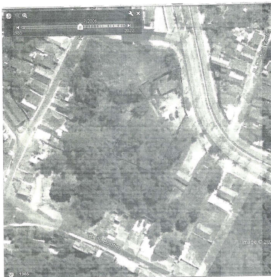
Figura 2. Ortofoto do ano de 2006 da região onde está inserido o imóvel sob exame, destacado pelo perímetro vermelho.

Pelo menos desde 2006 há um pequeno platô, com aproximadamente 200 m 2 de área na frente do terreno, conforme ilustrado pela Figura 2.