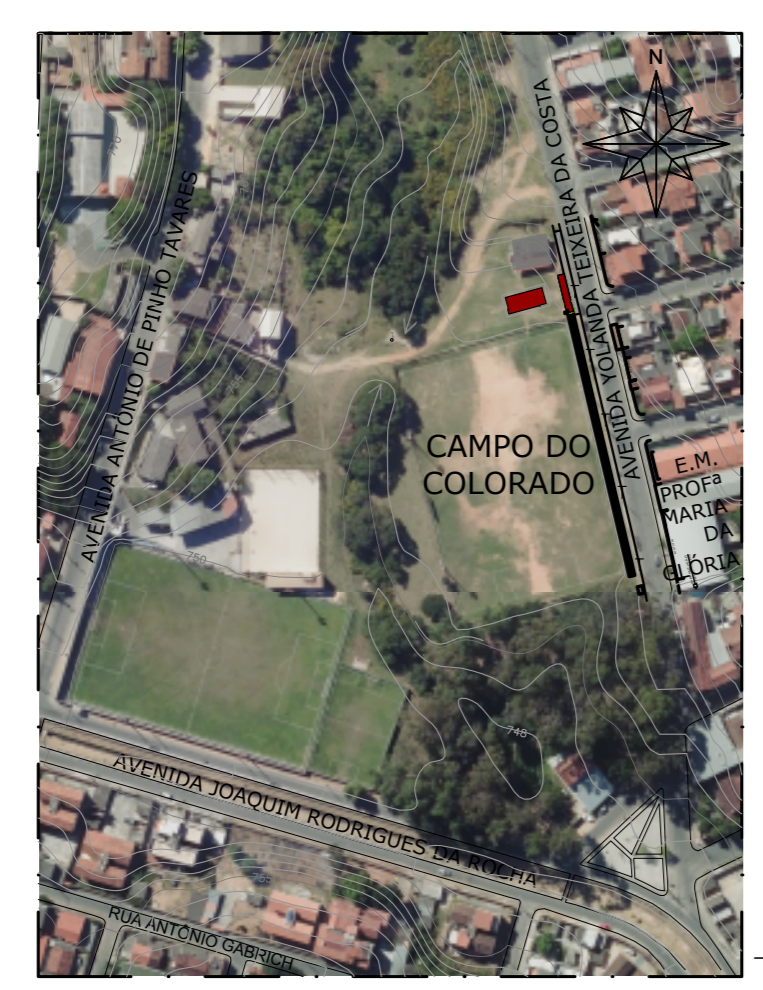
SITUAÇÃO ESCALA... 1/2500