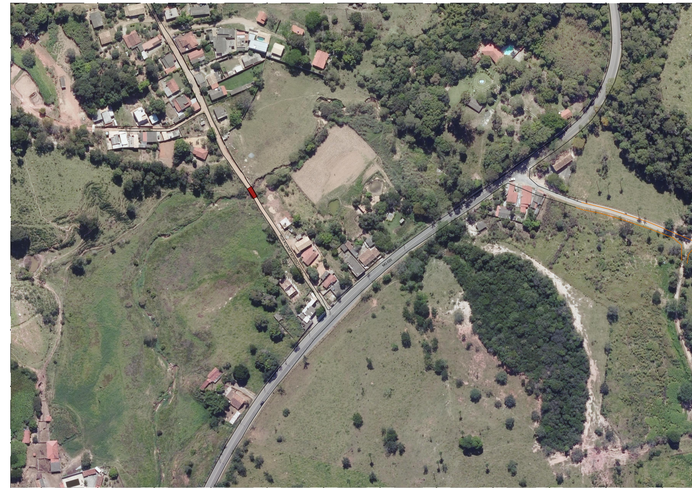
ÁREA DE INTERVENÇÃO SITUAÇÃO - PONTE DO FECHO ESCALA..... 1/2000