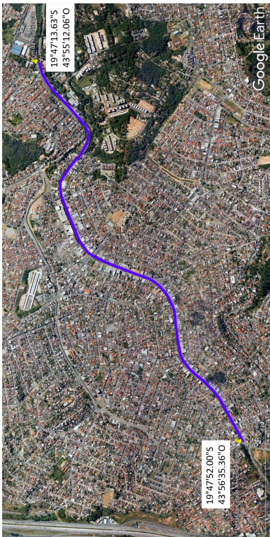
Figura 1 - Trecho de revitalização da iluminação da Avenida Brasília