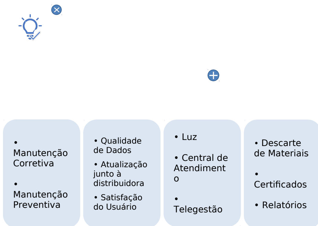
Figura 1 - Estrutura do SISTEMA DE MENSURAÇÃO DE

Apresenta-se a estrutura geral do SISTEMA DE MENSURAÇÃO DE DESEMPENHO na figura a seguir para melhor visualização. São demonstrados apenas os índices e subíndices com o intuito de prezar pelo entendimento da estrutura.