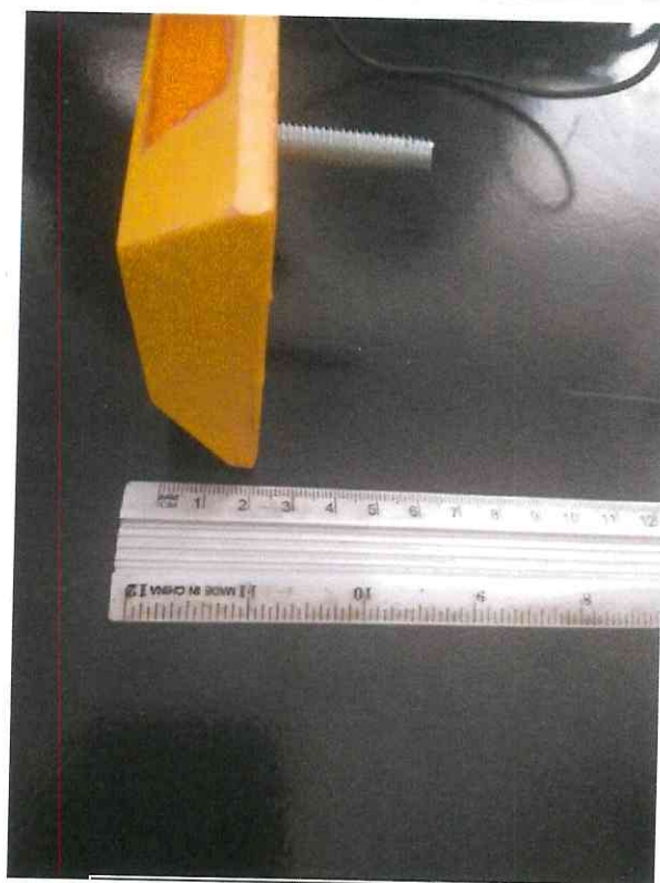
Foto da tacha reflexiva apresentada.