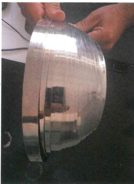
Foto da fita apresentada.