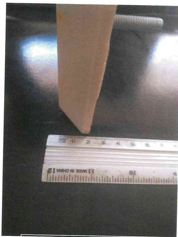
Foto da tacha refletiva apresentada