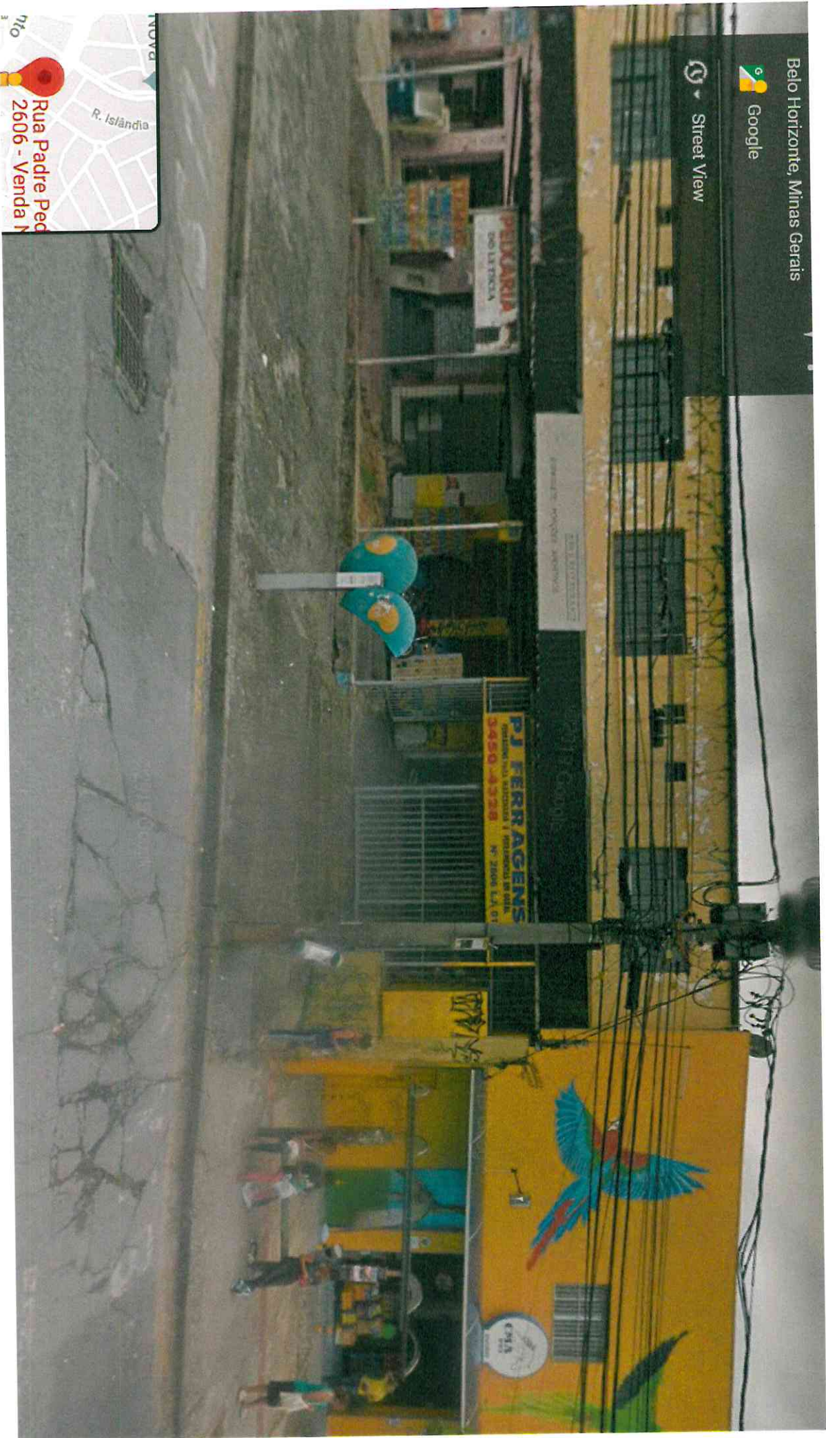
R. Padre Pedro Pinto, 2606 - Venda Nova, Belo Horizonte - MG, 31615-310