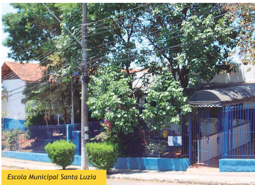
Escola Municipal Santa Luzia

E stão sendo realizados investimentos nunca vistos nas instituições municipais de ensino de Santa Luzia. São aportes que irão melhorar a infraestrutura de todas as escolas da rede.