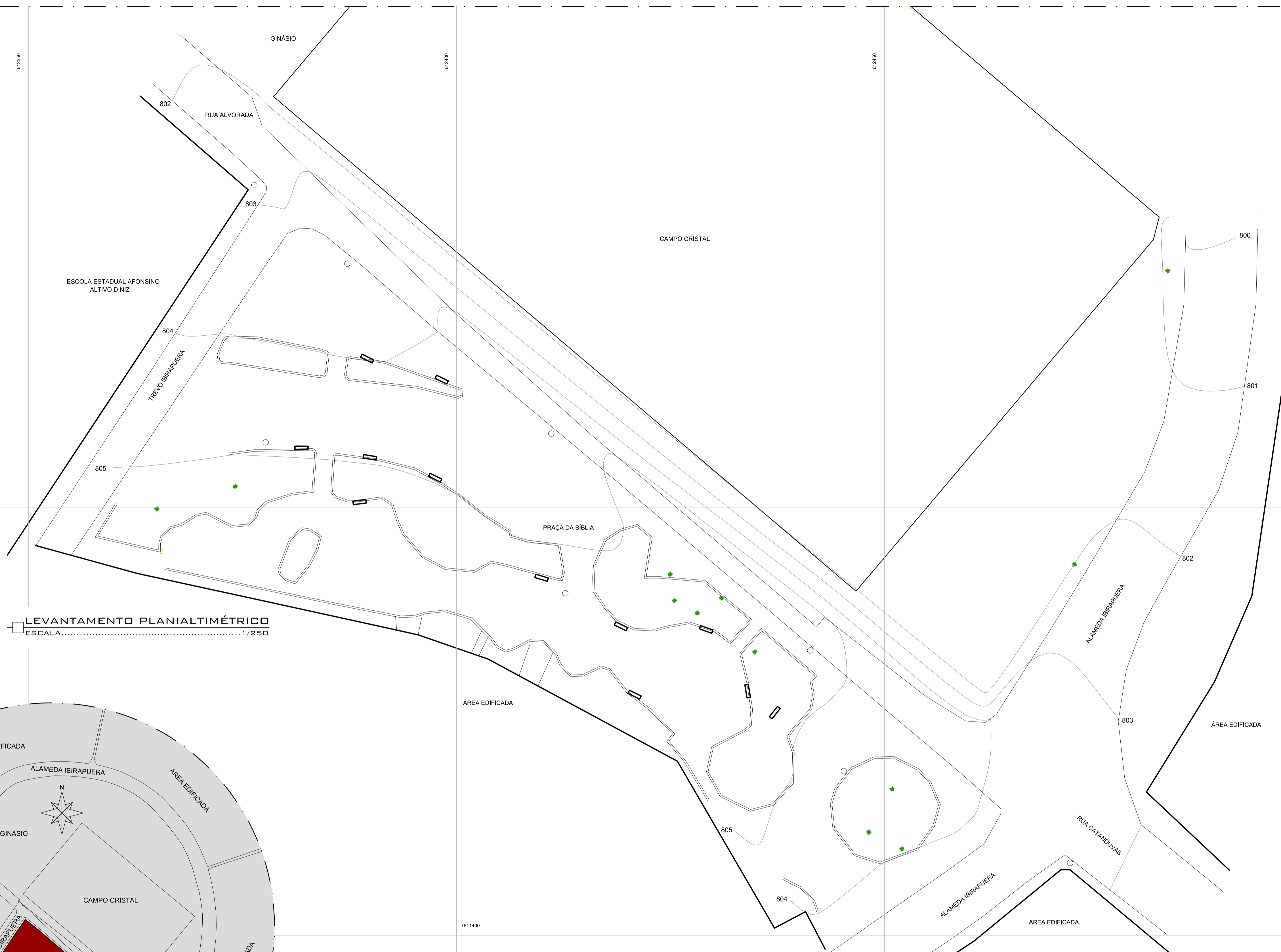
LEVANTAMENTO PLANIALTIMÉTRICO ESCALA..... 1/250