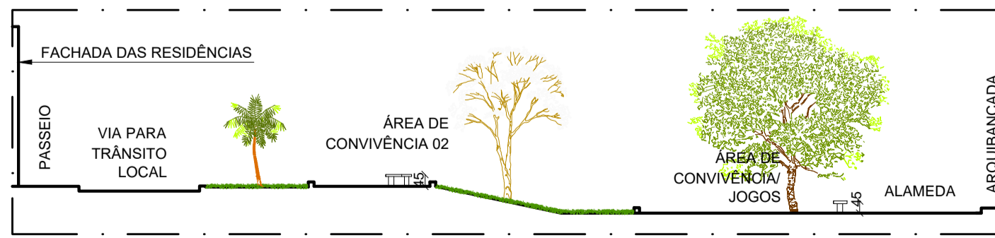
CORTE ESQUEMÁTICO BB ESCALA..... 1/200