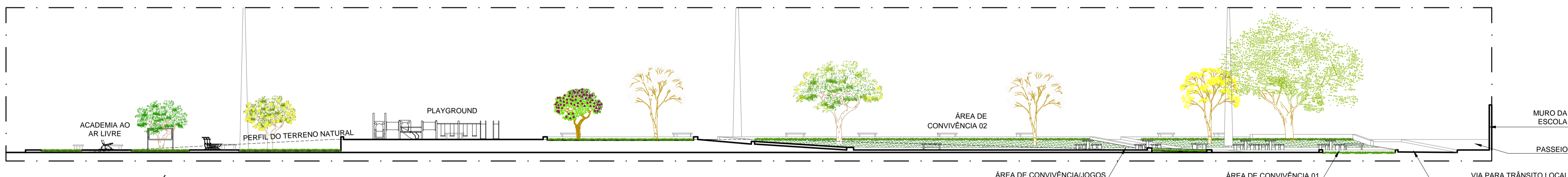
CORTE ESQUEMÁTICO AA ESCALA..... 1/200