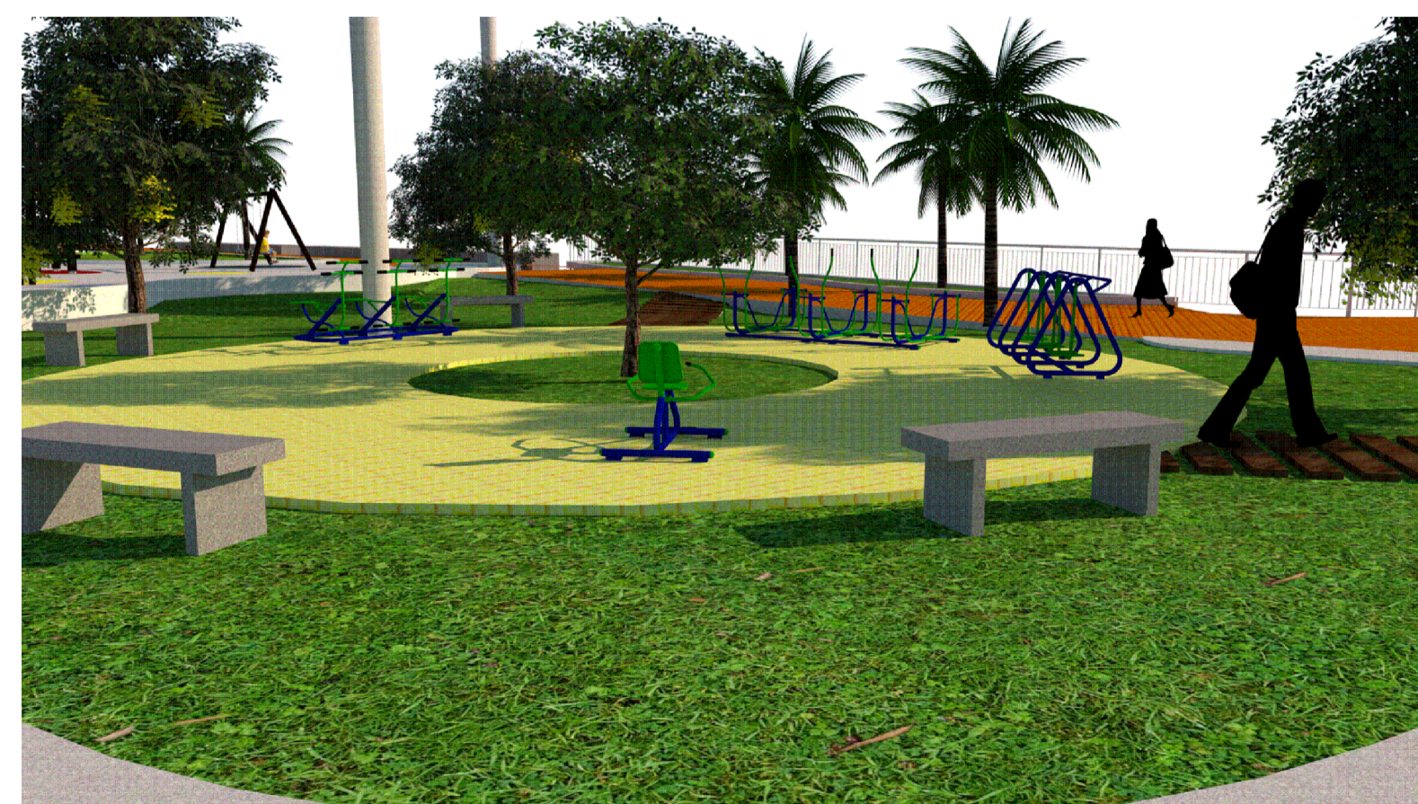
PERSPECTIVA 01 IMAGEM SEM ESCALA