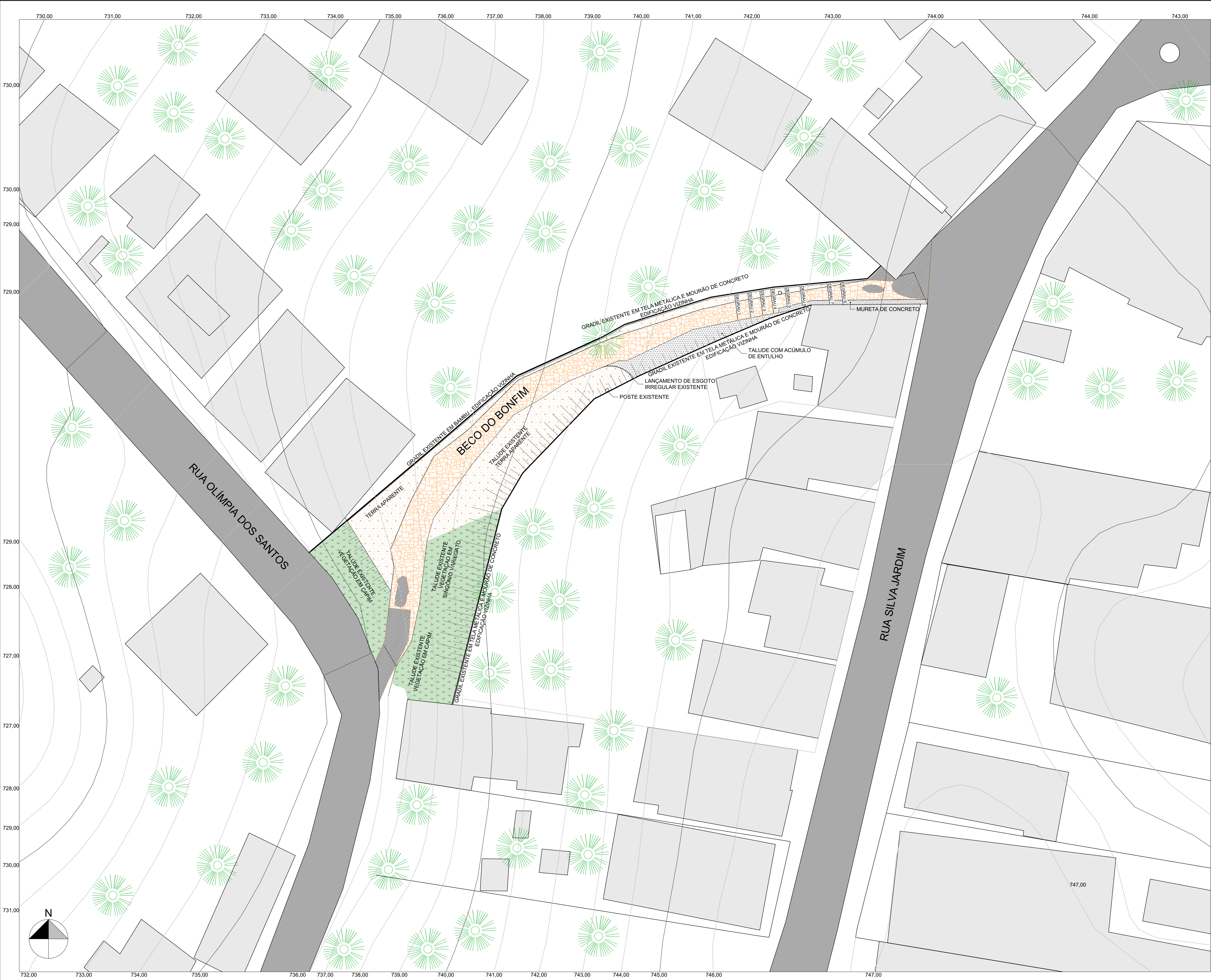
LEVANTAMENTO CADASTRAL ESCALA.....1/200

NOTAS: 1. A EXECUÇÃO DA RECUPERAÇÃO DO PISO DE CALÇAMENTO EM PEDRAS "CABEÇA DE NEGRO" SERÁ ACOMPANHADA PELA EQUIPE DE ARQUEOLOGIA E ARQUITETURA DAS SECRETARIAS MUNICIPAIS DE CULTURA E TURISMO, E OBRAS, PARA AVALIAÇÃO DA EXTENSÃO ORIGINAL DO PISO DE PEDRAS.