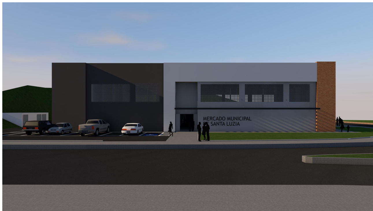
PERSPECTIVAS ILUSTRATIVAS SEM ESCALA