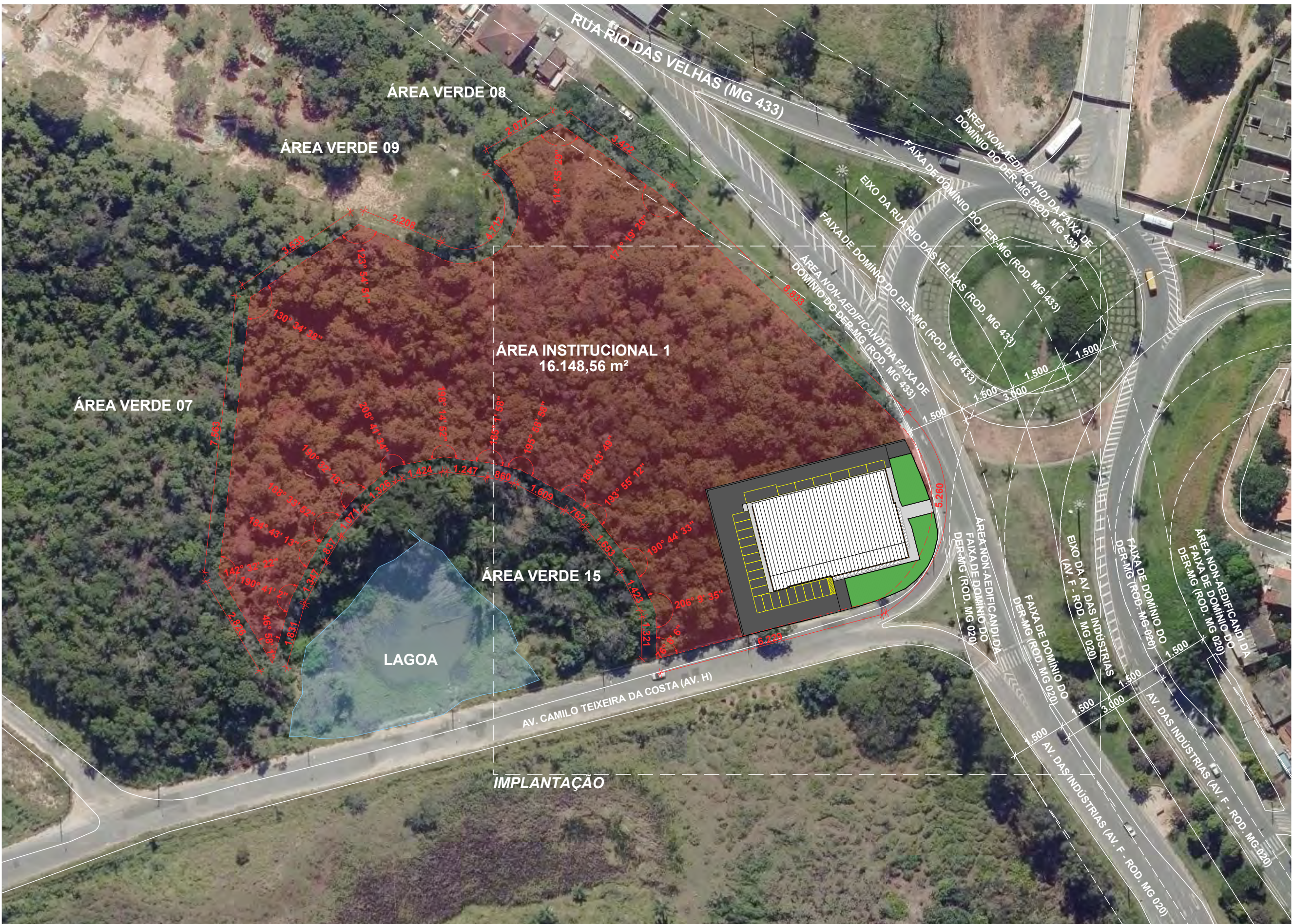
LOCALIZAÇÃO E MAPA-CHAVE ESCALA: 1:1000