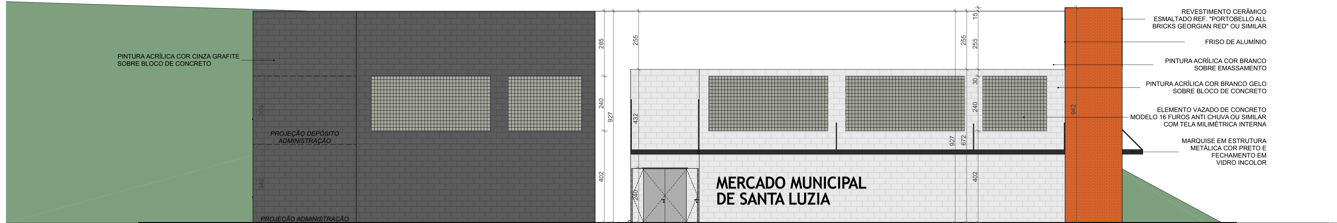
FACHADA AV. CAMILO TEIXEIRA DA COSTA ESCALA: 1:75