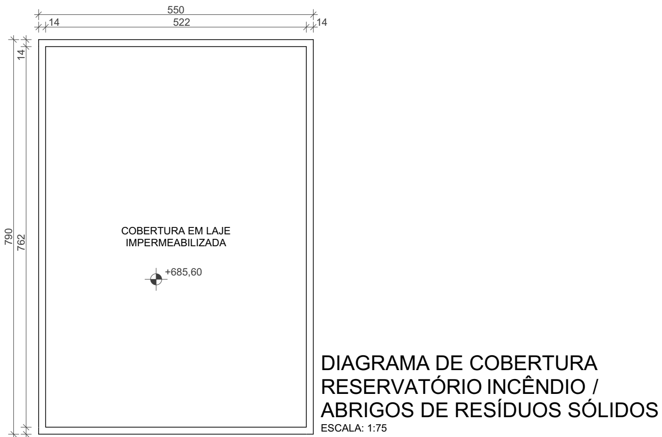
DIAGRAMA DE COBERTURA RESERVATÓRIO INCÊNDIO / ABRIGOS DE RESÍDUOS SÓLIDOS ESCALA: 1:75