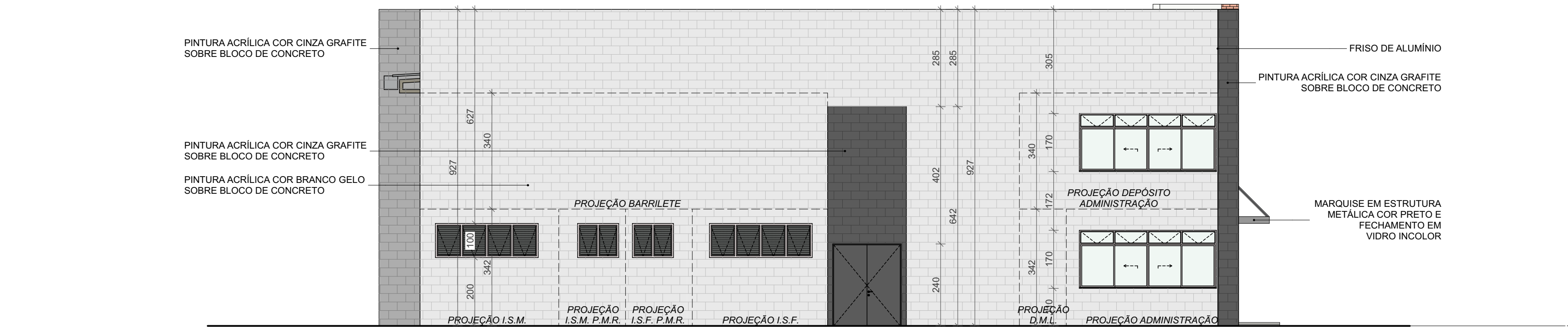
FACHADA LATERAL ESQUERDA ESCALA: 1:75