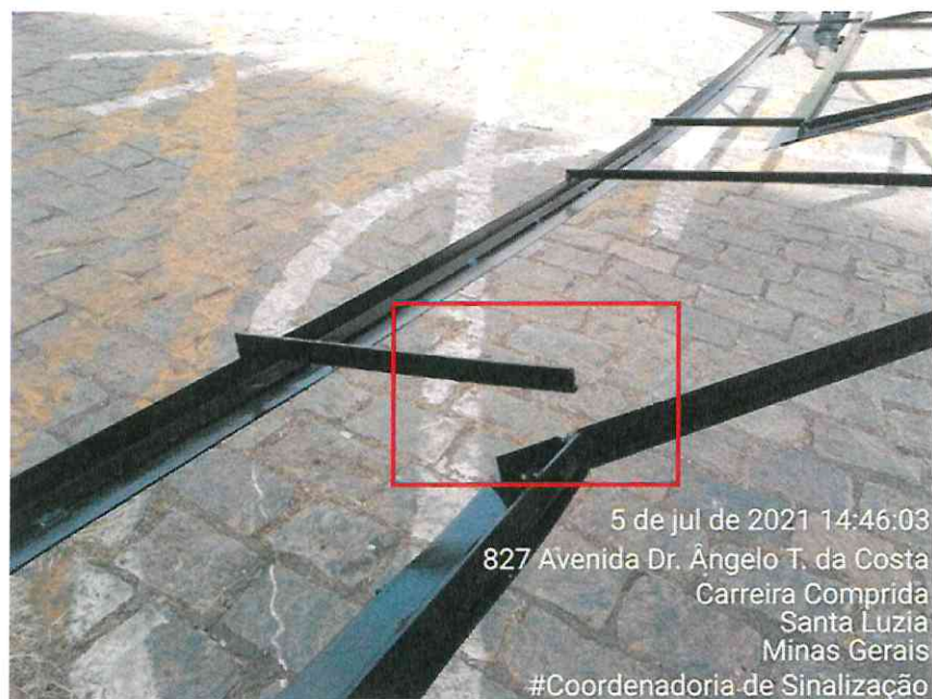
Figura 4: Destaque para a emenda quebrada