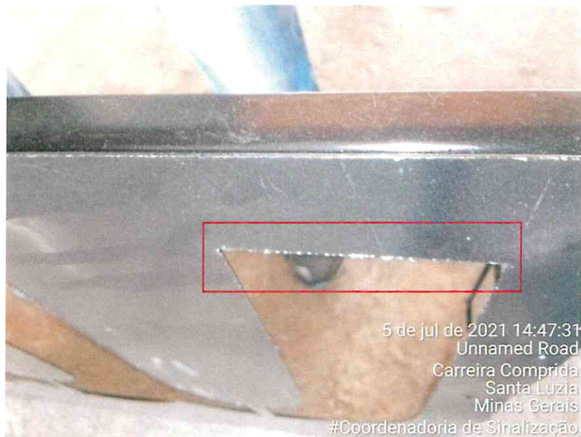
Figura 3: Destaque para o acabamento mal feito (superfície irregular)