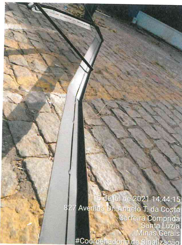
Figura 7: Destaque para peça empenada

Faz-se mister destacar que o item 02, vencido pela empresa TINPAVI INDUSTRIA E COMERCIO DE TINTAS EIRELI não foi entregue no prazo, portanto, solicita-se a desclassificação da referida empresa. Detalha-se a seguir o referido item: