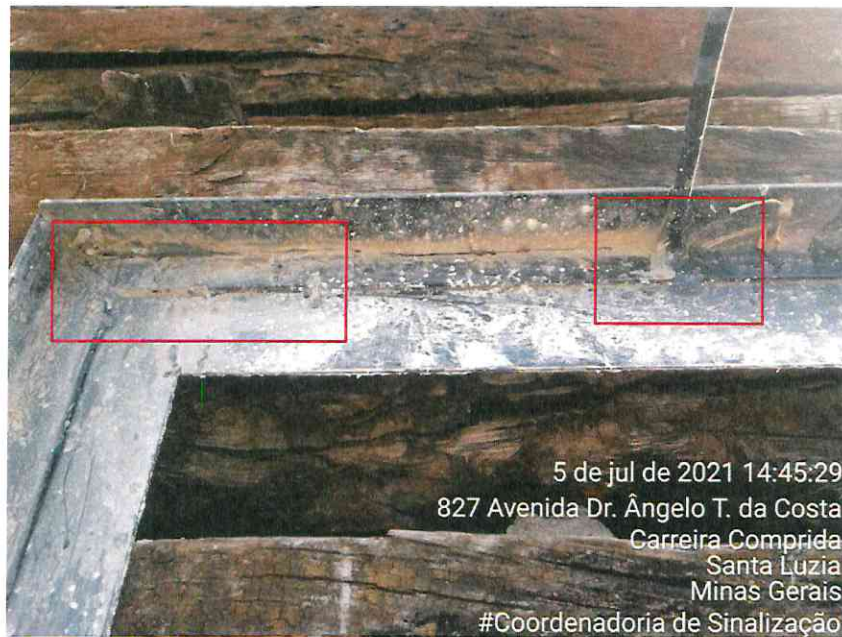
Figura 5: Destaque para os pontos de solda na parte interna, dificultando a limpeza após o uso