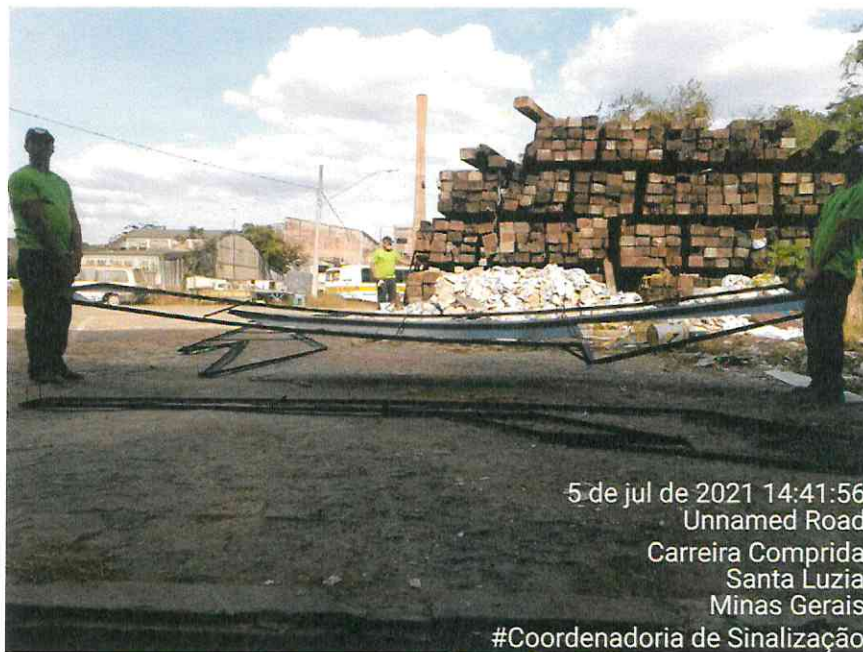
Figura 6: Destaque para o comprimento da peça, dificultando o manuseio e transporte (chapa fletindo no centro)