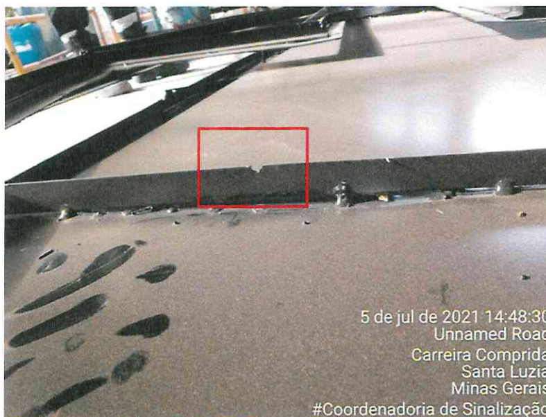
Figura 1: Destaque para o acabamento mal feito (cantoneira com falha – quinas vivas / risco de corte)

mais de 5m de comprimento), o que inviabiliza o transporte e a praticidade do trabalho. Pelo peso e comprimento, as peças chegam a fletir (envergar). De forma complementar, ilustra-se nas imagens seguintes os problemas supracitados: