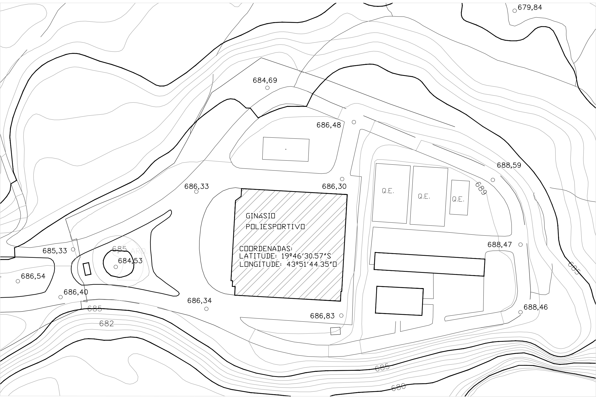
PLANTA DE SITUAÇÃO