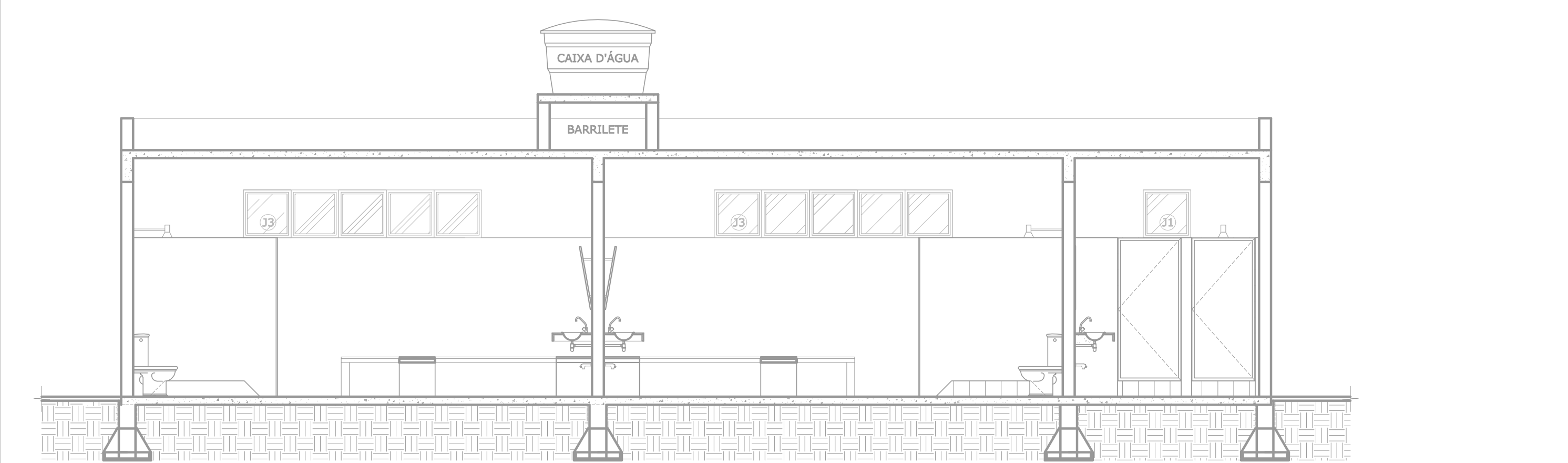
CORTE A-A ESCALA.....1/50