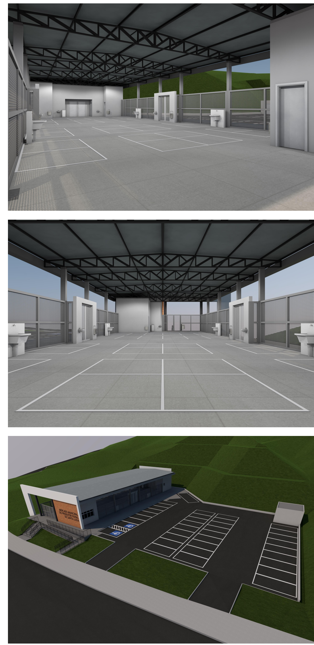
PERSPECTIVAS ILUSTRATIVAS SEM ESCALA