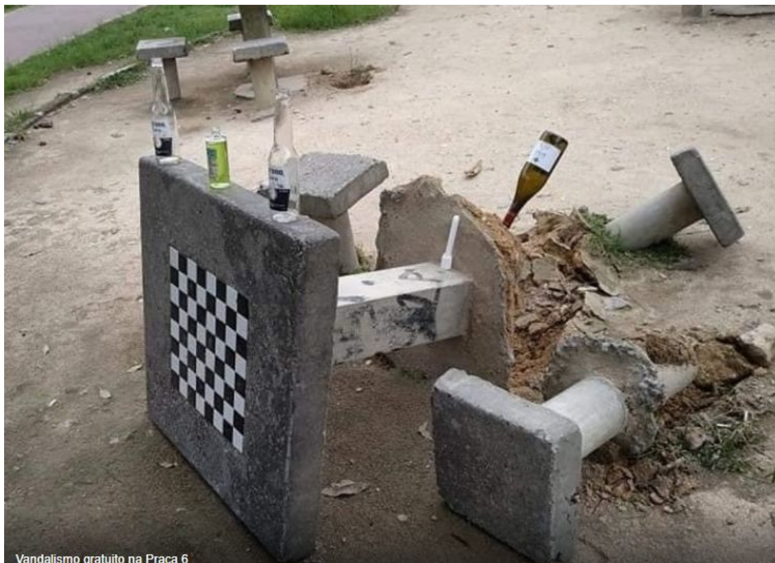
Vandalismo gratuito na Praça 6

https://jornaldorecreio.com.br/materias/vandalismo-na-praca/