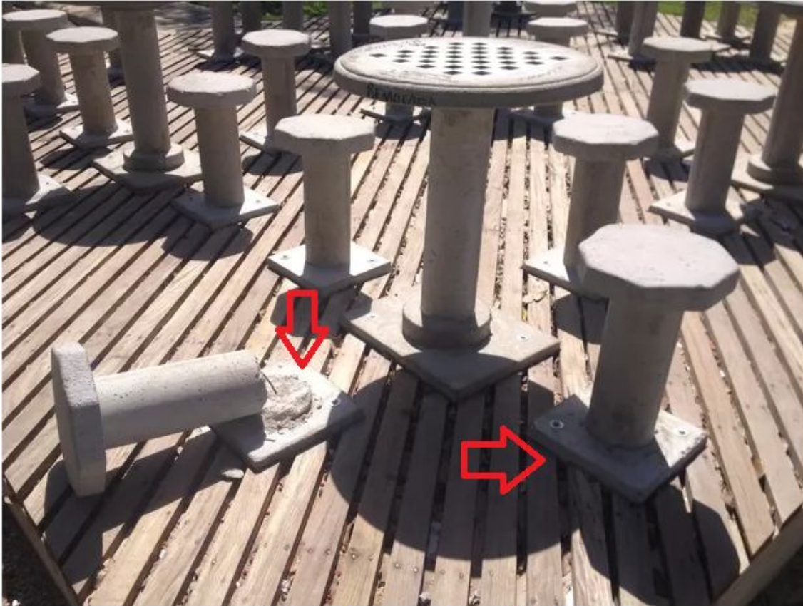
Banco em concreto da praça Veiga Cabral, em Macapá, foi quebrado (Foto: Jorge Abreu/G1)

https://g1.globo.com/ap/amapa/noticia/2016/07/reformada-menos-de-um-mes-praca-de-macapa-e-alvo-de-vandalismo.html