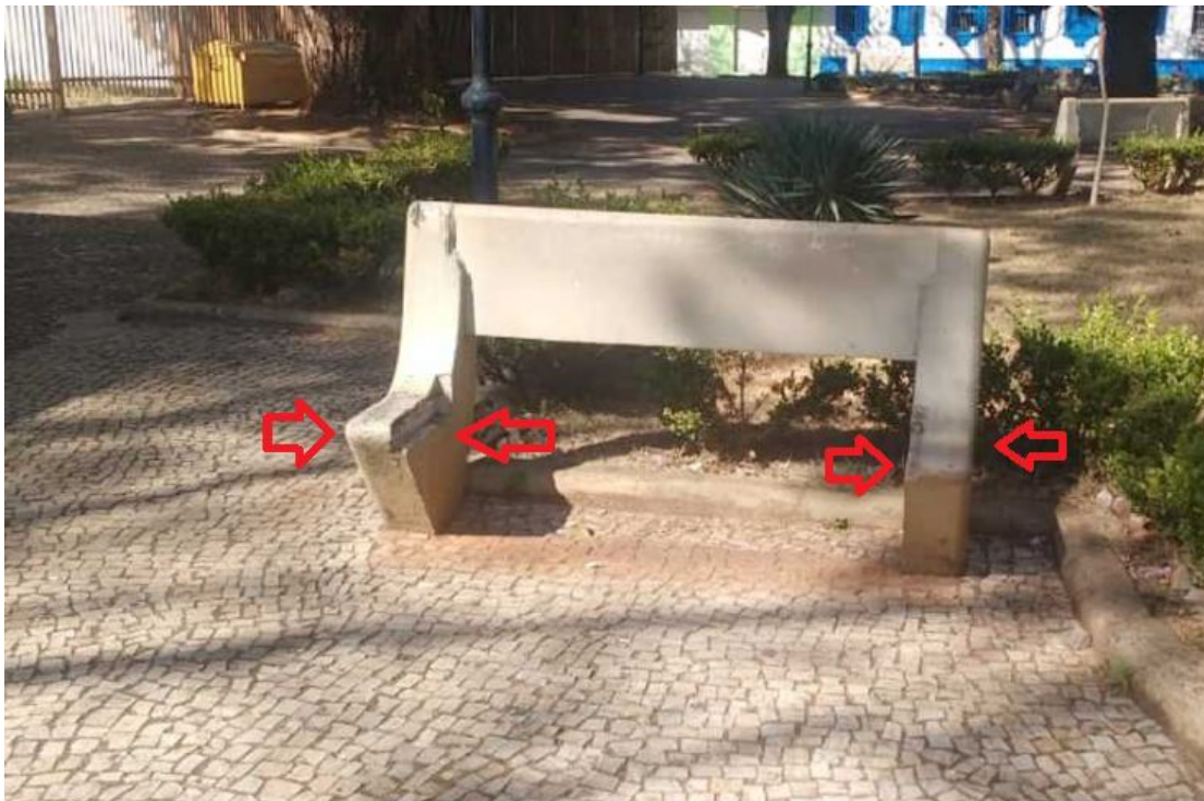
Na Praça Com. João Alves, Fonte Luminosa, seis bancos de concreto estão com os acentos quebrado

https://jornaldosudoeste.com.br/noticia.php?codigo=204359