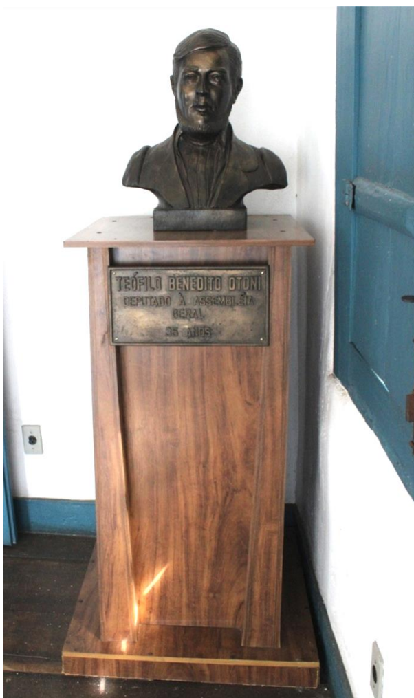
Busto de Teófilo Ottoni Data: 05/07/2022