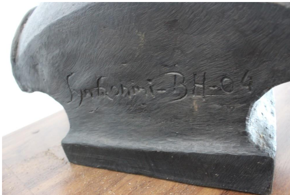
Busto de Teófilo Ottoni