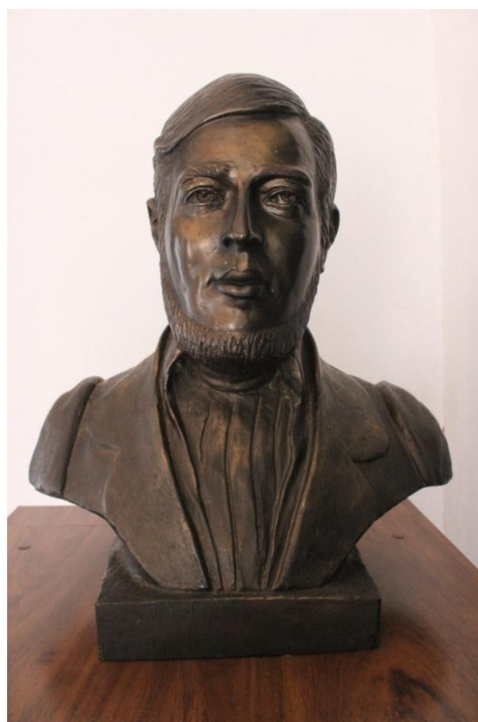
Busto de Teófilo Ottoni Data: 05/07/2022