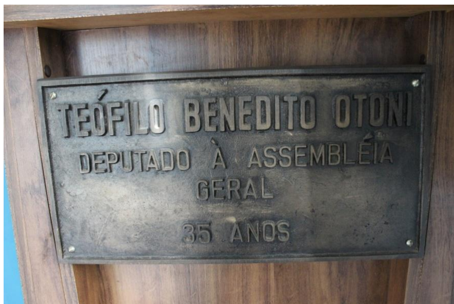
Busto de Teófilo Ottoni