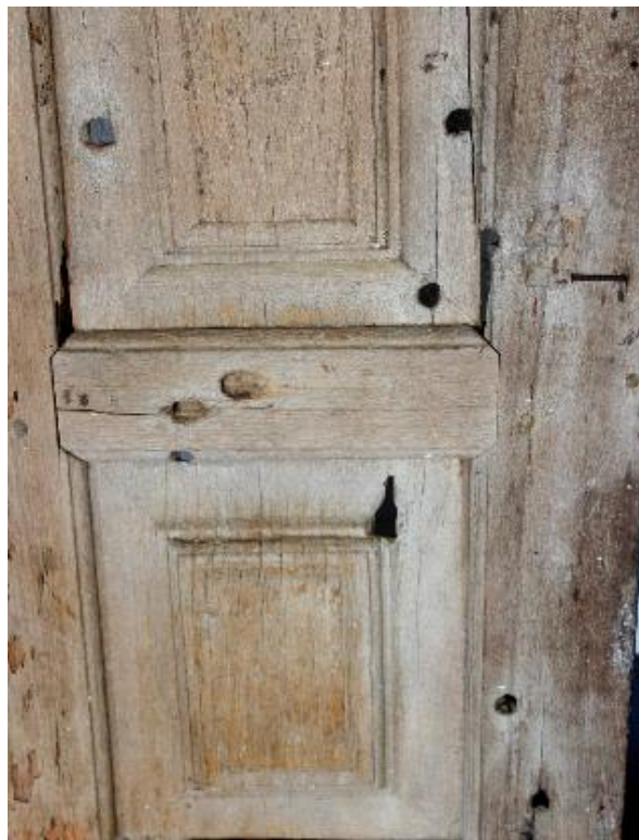
Detalhe das marcas de bala na Folha/Bandeira de Janela