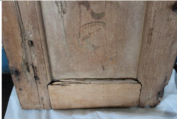
Lado inferior da Folha/Bandeira de Janela