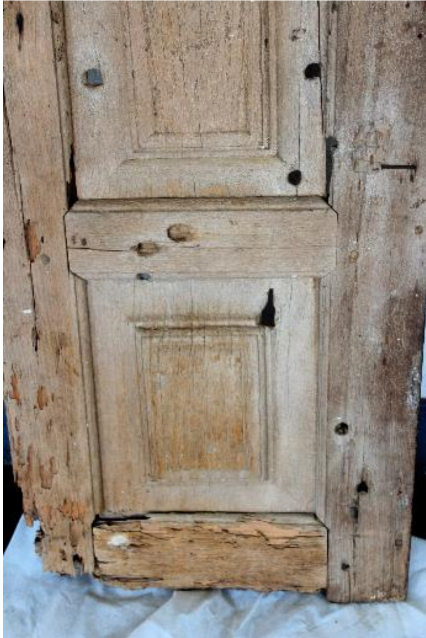
Detalhe das galerias de cupins na parte inferior