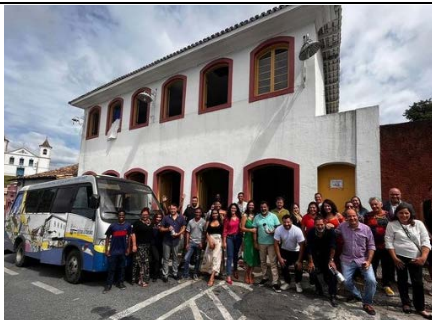
Visita guiada ao Circuito de Presépios no ônibus da SECULT Dezembro/2022

Divulgação do Circuito de Presépios no Jornal Hoje (Rede Globo de Televisão) Dezembro/2022