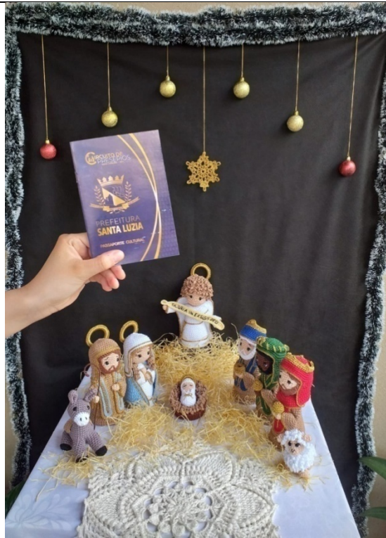
Passaporte do Circuito de Presépios 01/12/2022