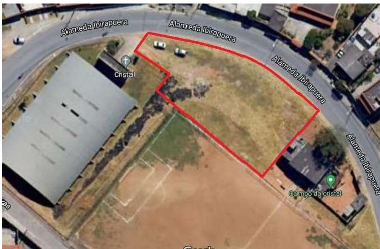
Figura 1 – Localização do terreno e área de intervenção

A Contratada deverá realizar visita no local para verificar as necessidades e as demandas deste documento.