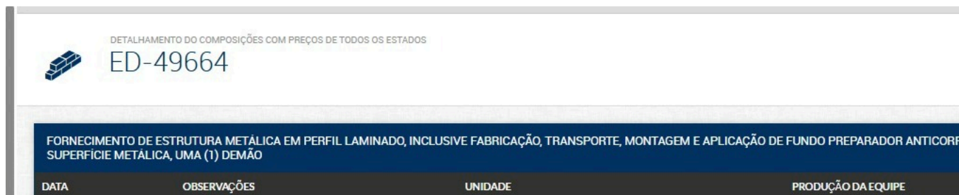
Imagem 03: Descrição do item código ED-49664 - Referência SEINFRA.

Ressaltamos que a atualização da data-base da planilha orçamentária, realizada pela Secretaria de Obras, não contemplou alterações de itens e/ou quantitativos, restringindo-se exclusivamente à atualização de preços.