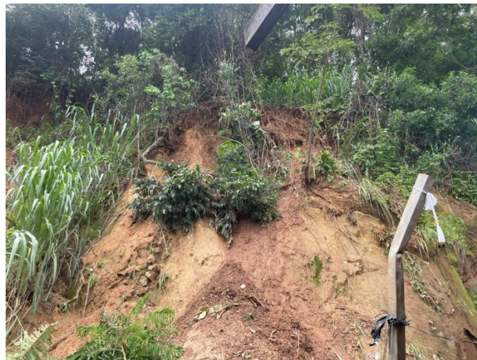
10 - Deslizamento de talude na Rua 28 de Fevereiro Bairro Vila Nova Esperança (remoção de aproximadamente 7 famílias);