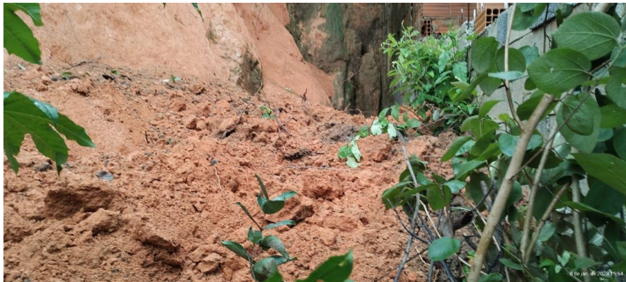
06 - Deslizamento de Talude na Rua Doutor Cassiano Augusto Oliveira Lima Nº 522;