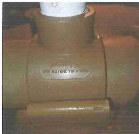
FOTO 8- Cópia da ORSE (12868) - Colar tomada pvc, com travas, saída com rosca, de 75 mm x 1/2" ou 75 mm x 3/4", para ligação predial de água