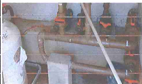
Foto42:PROTEÇÃO MECANICA COM ARGAMASSA, TRAÇO 1:3 (CIMENTO E AREIA), ESP. 15MM, APLICAÇÃO MANUAL, PREPARO MECÂNICO, INCLUSIVE