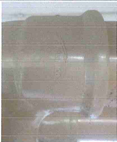
FOTO22:JOELHO 90 PVC RIGIDO SOLDAVEL 110mm