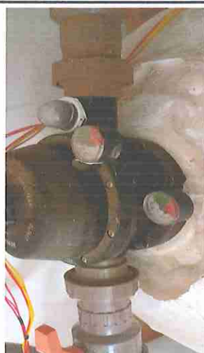
FOTO.9-UNIAO PVC SOLDAVEL 60mm