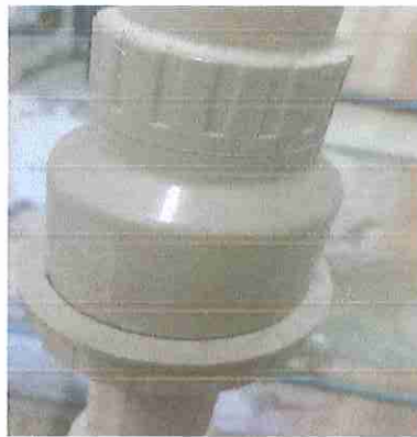
FOTO 18: VÁLVULA DE RETENÇÃO HORIZONTAL OU VERTICAL, Ø 50 MM (2")