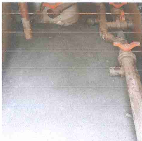
Foto. 40:CONTRAPISO DESEMPENADO COM ARGAMASSA, TRAÇO 1:3 (CIMENTO E AREIA), ESP. 20MM