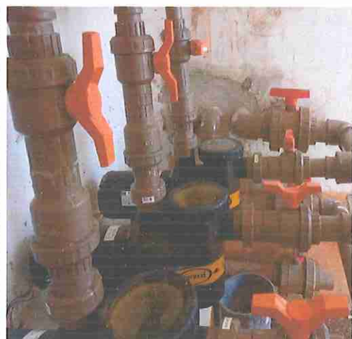
FOTO11: REGISTRO DE ESFERA, PVC, SOLDAVEL, COM VOLANTE, DN 60 MM - FORNECIMENTO E INSTALAÇÃO. AF 08/2021