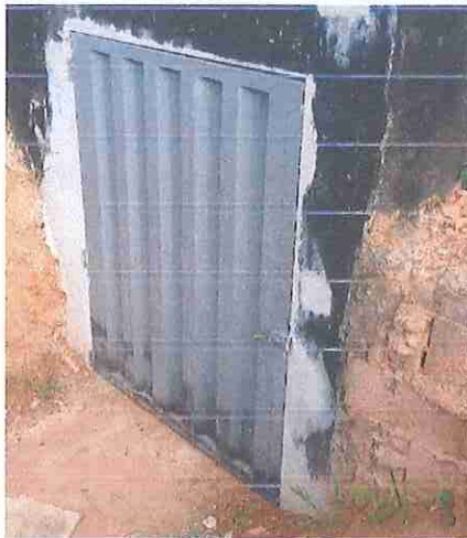
FOTO 24:PORTÃO DE FERRO PADRÃO, EM CHAPA (TIPO LAMBRI), COLOCADO COM CADEADO