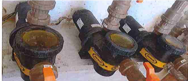
FOTO 2: FORNECIMENTO E INSTALAÇÃO DE BOMBA TRIFÁSICA 3CV PARA PISCINAS, INCLUSIVE PRÉ-FILTRO